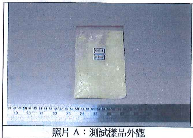
照片 A：測試樣品外觀